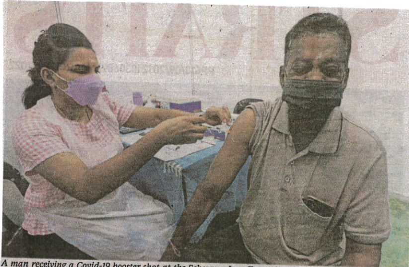
A man receiving a Covid-19 booster shot at the Seberang Jaya Expo Site vaccination centre in Seberang Jaya, Penang, on Saturday.