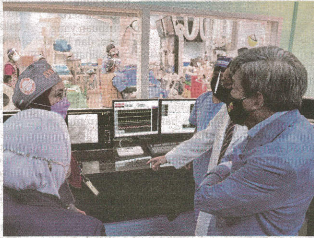
SULTAN Sharafuddin berkenan mencemar duli melawat Makmal Invasif Kardiologi Hospital Serdang, semalam.

memberikan rawatan kecemasan kepada pesakit serangan jantung dengan mempelopori rangkaian ST-elevation myocardial infarction (STEMI).