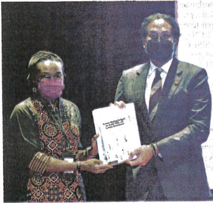
Khairy (kanan) melancarkan buku Systems Thinking Analyses for Health Systems Policy and Systems Development: A Malaysian Case Study di Pusat Konvensyen Kuala Lumpur pada Isnin.

AKHBAR : SINAR HARIAN MUKA SURAT : 10 RUANGAN : VAKSIN UNTUK RAKYAT