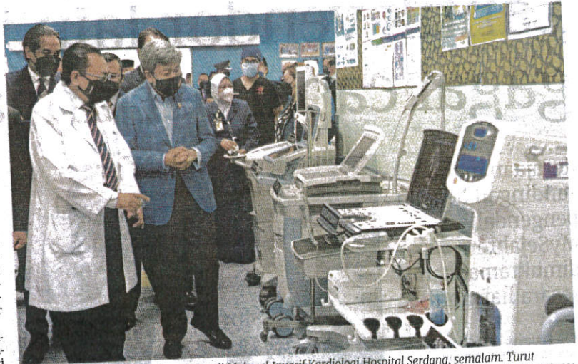
Sultan Sharafuddin melihat peralatan di Makmal Invasif Kardiologi Hospital Serdang, semalam. Turut kelihatan Khairy.

Sultan Sharafuddin turut diberi taklimat mengenai pembangunan fasiliti kesihatan negeri Selangor yang disampaikan BERNAMA Khairy.