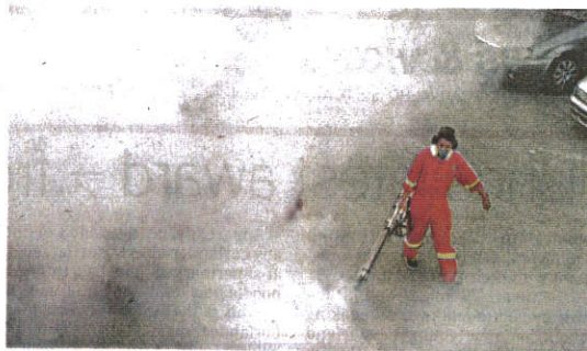
The battle still goes on: A DBKL staffer doing mosquito fogging.

"In order to curb the spread of dengue in outbreak areas, thermal spraying or fogging would also be